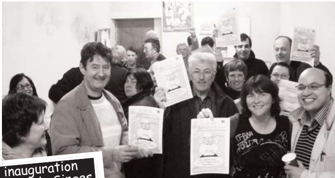
inauguration des Trois Singes Décembre 2008