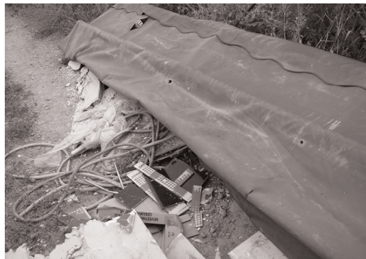
Les espaces publics retrécissent, les décharges sauvages se multiplient.

Sur la Côte d'Azur et en d'autres lieux du littoral, les citoyens ont reconquis « le chemin des douaniers », ce petit sentier qui longe la mer, propriété inaliénable de l'Etat et donc des promeneurs, et que certains propriétaires fortunés s'étaient ingénié à privatiser, à l'abri de leurs clôtures. Piétons de Beaucaire, flâneurs de tout poil, frères et sœurs en tranquilles déambulations,